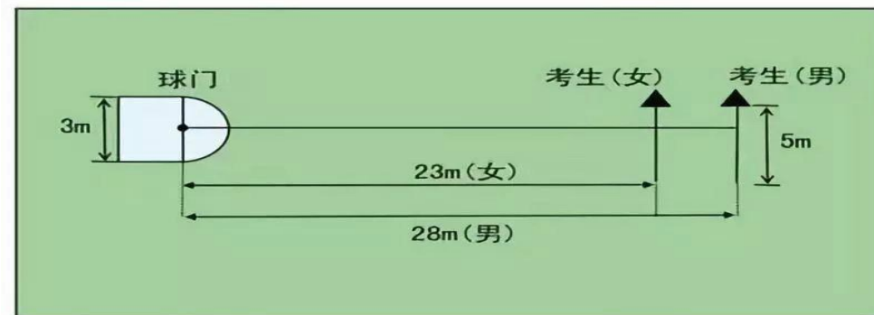
表13：传准测试示意图